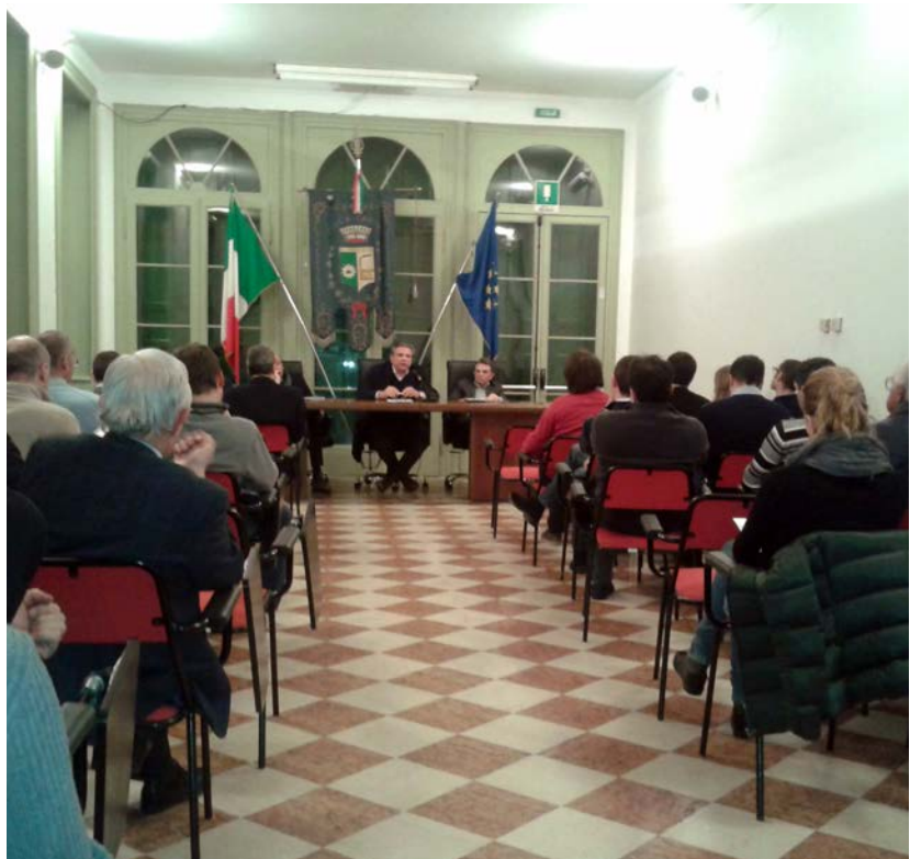
Un momento del primo incontro dedicato alla Valtrompia

Gli incontri sono un'occasione utile per ricordare sia l'importanza di fare sistema (oggi più che mai), sia i servizi che l'Associazione mette gratuitamente a disposizione delle imprese iscritte.