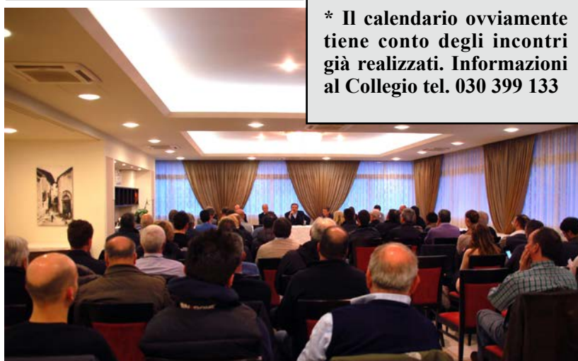
Anche il secondo incontro, in Valle Camonica, ha visto la partecipazione di numerosi imprenditori.