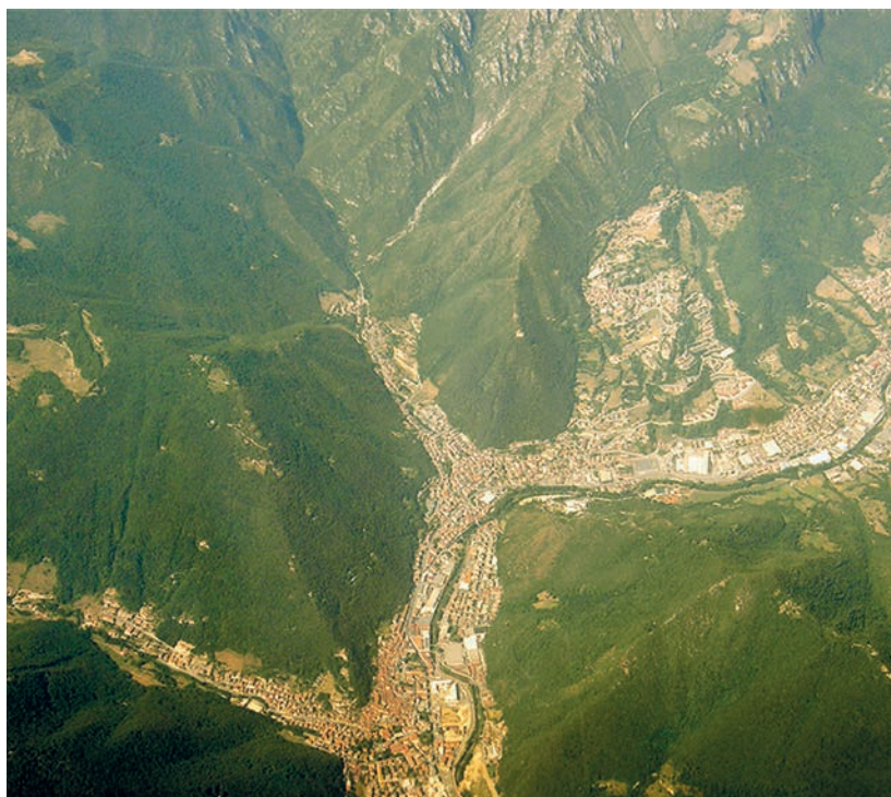
L'autostrada di Valtrompia è un progetto atteso da 50 anni