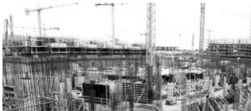
Sanpolino rappresenta un'idea integrata per un nuovo quartiere

Prende forma il nuovo quartiere di Sanpolino, dove sta per nascere una sorta di "piccola città" a sud-est, con oltre 1900 alloggi che potrebbero essere ultimati nel 2007. Uffici e negozi tra una casa e l'altra, parchi e parcheggi, scuole e fermate dei mezzi pubblici, compresa una stazione del metrobús. Non solo residenza, ma centro di vita pulsante e autosufficiente tra San Polo e Sant'Eufemia. Così sarà Sanpolino: tre comparti attualmente in costruzione (ma ne sono previsti altri due) disposti a lato di un grande asse centrale segnato dal percorso del metrò. In senso perpendicolare al tracciato della metropolitana, si sviluppa una fascia verde che ora segna il confine degli attuali comparti, ma in seguito sarà centrale anch'essa. L'attenzione, poi, per gli spazi sociali pare alta e anche i luoghi collettivi non mancheranno. A Sanpolino sorgono due sale pubbliche, un auditorium, una palestra, un asilo nido. Se si aggiungono ai 12 mila metri quadrati di aree riservate al commerciale, la superficie destinata al terziario e ai servizi sale a 28 mila metri quadrati. A considerare solo i 775 alloggi messi in vendita sino ad ora e le superfici terziarie, si raggiunge quota 93 mila metri quadrati, per un valore che il Comune stima intorno ai 126 milioni di euro. "Con que-