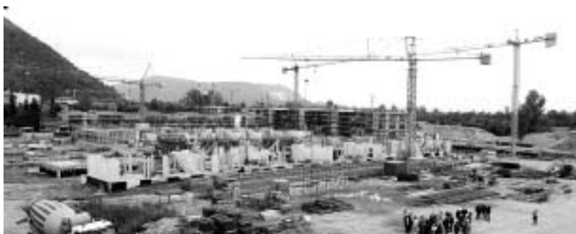
L'area ospiterà servizi ed oltre 1900 alloggi

A considerare solo i 775 alloggi messi in vendita sino ad ora e le superfici terziarie, si raggiunge un valore che il Comune stima intorno ai 126 milioni di euro.