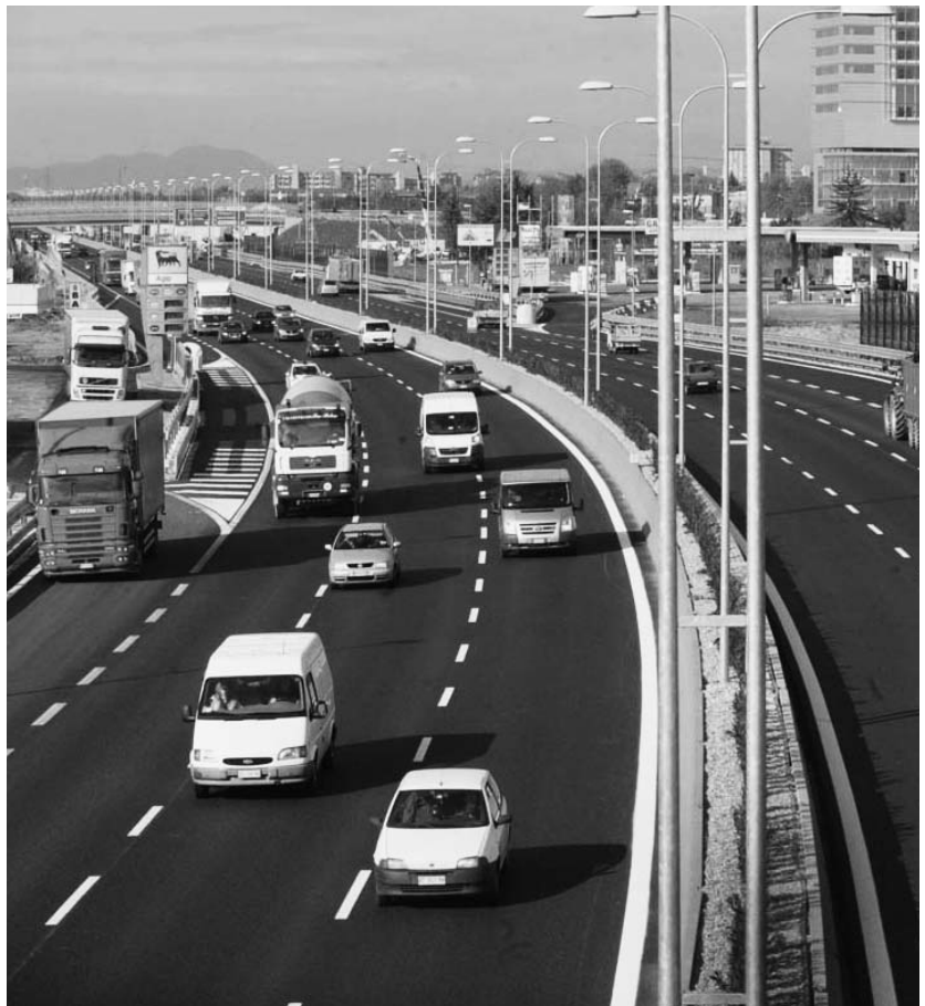
Un tratto della nuova tangenziale sud ampliata a tre corsie

Tornando alla genesi della terza corsia, il fiore all'occhiello del progetto sono i numeri: 5,580 sono i chilometri realizzati, percorso compreso tra i caselli di Brescia Ovest e Brescia Centro che oggi appare composto da tre corsie di marcia più una di emergenza, su cui il limite di velocità è stato portato a 110 km all'ora. Dal punto di vista della scorrevolezza la grande no-