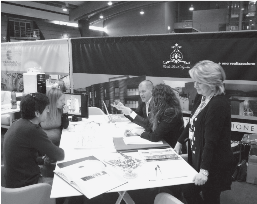
Il meeting è stata un'occasione di incontro con la potenziale clientela

LE NUOVE FRONTIERE DELL'EFFICIENZA ENERGETICA: UN TEMA MOLTO CARO AL COLLEGIO COSTRUTTORI