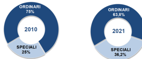
APPALTI PUBBLICI PER LAVORI Composiz.% del valore a base di gara (bandi e inviti di importo ≥40mila€) per tipologia di settore