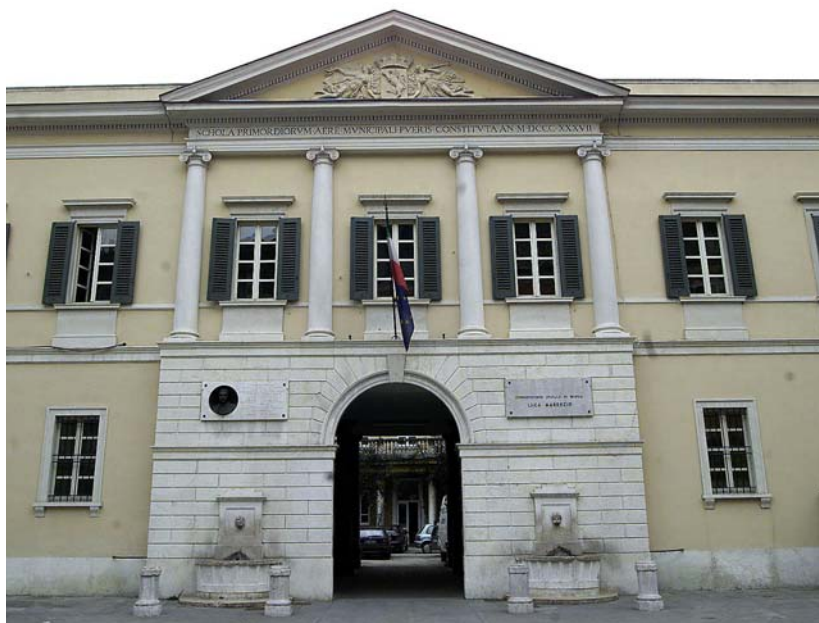
La sede del Conservatorio di Brescia

Ben più consistente l'importo relativo ai cantieri aperti, che danno una previsione di spesa di oltre 15 milioni di euro. Per la realizzazione della nuova sede dell'istituto tecnico Marco Polo di Desenzano ne serviranno quasi 5, mentre oltre 2 sono destinati alla ristrutturazione e messa a norma del Conservatorio Luca Marenzio in città. All'itis Castelli di via Cantore, serviranno ben più di 500 mila euro per opere di manutenzione straordinaria. Per la rimozione dell'amianto da diverse strutture cittadine si dovranno spendere circa 750 mila euro, mentre alla Pastori è stato investito altrettanto per altre opere. Nuove palestre sono in via di costruzione al Capirola di