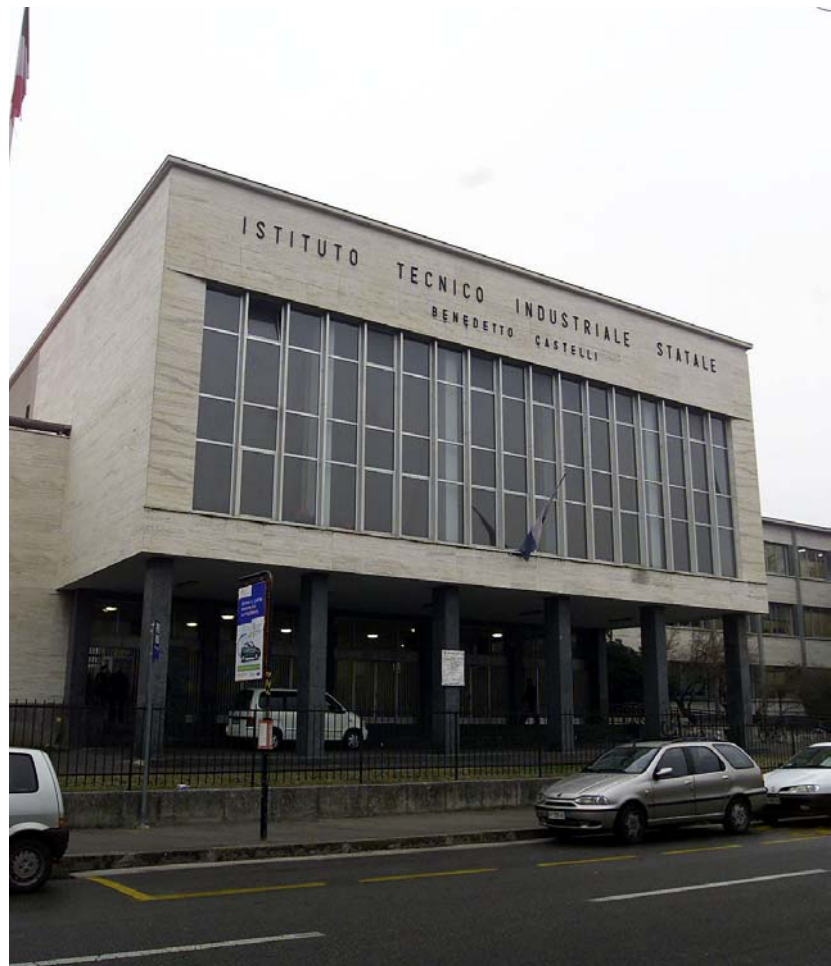
L'Itis Castelli di Brescia