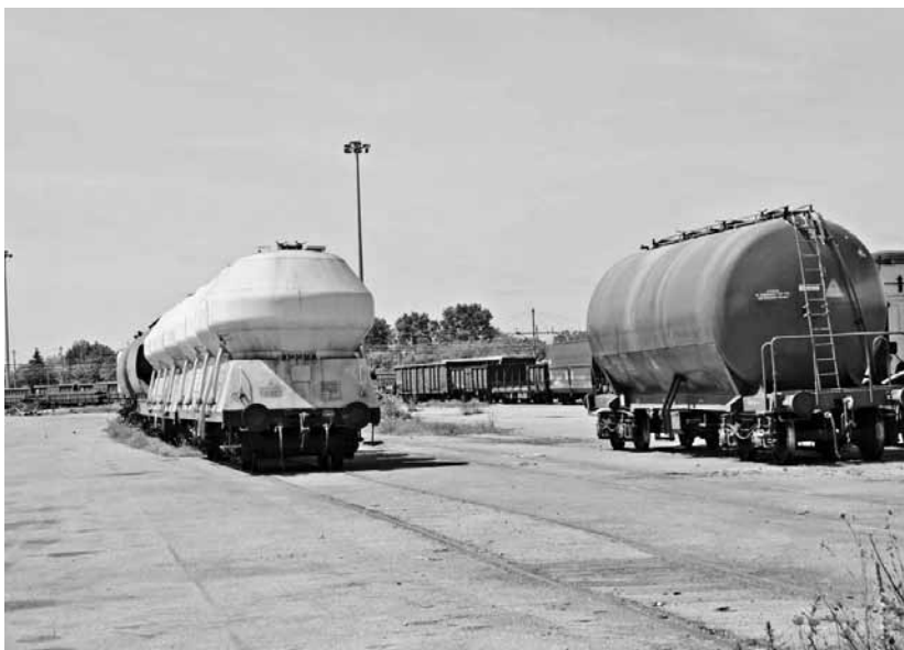
Il progetto della Piccola Velocità, lo scambio ferro-gomma bresciano, ancora non decolla nonostante l'impegno dei privati

Aspettando fatti concreti sulla Rocca d'Anfo e sul comprensorio turistico della Valcamonica, buone nuove arrivano dalla Fascia d'Oro,