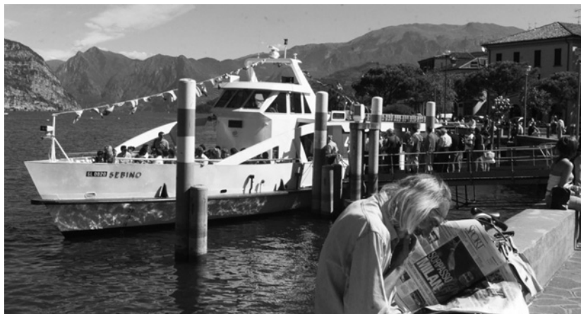
Iseo è la "capitale" turistica del Sebino

Il Piano regolatore, in vigore dal 1999, anno nel quale venne approvata la variante generale, si appresta, dunque, ad essere "licenziato" per la nuova formula che la legge prevede. Nel computo delle opere pubbliche realizzate sino al 2005, spicca una cifra complessiva che la dice lunga. Sono stati spesi ben 18 milioni di euro dal Comune di Iseo, in parte anche con contributi regionali e provinciali, che sottolineano la vivacità delle azioni progettuali avviate. Le voci più imponenti sono quelle dell'edilizia scolastica che allinea interventi già realizzati per 2 milioni e 200 mila euro, per quanto riguarda le tre materne, le due elementari di Clusane e Iseo e la media del capoluogo. Nel 2006 sono contemplati altri 250 mila euro per la materna iseana, mentre sono stati spesi per il Centro di formazione professionale di Clusane 700 mila euro. In particolare va sottolineata la costruzione della nuova sede dell'Ipsia e del liceo scientifico, nati da un accordo di programma con la Provincia, che ha comportato un esborso di 3 milioni di euro (la metà circa a carico del Comune); un plesso all'avanguardia che ha facciate energetiche, progettato con i principi di bioarchitettura e bioclimatica, che ospita circa 120