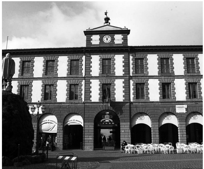
La sede municipale di Iseo