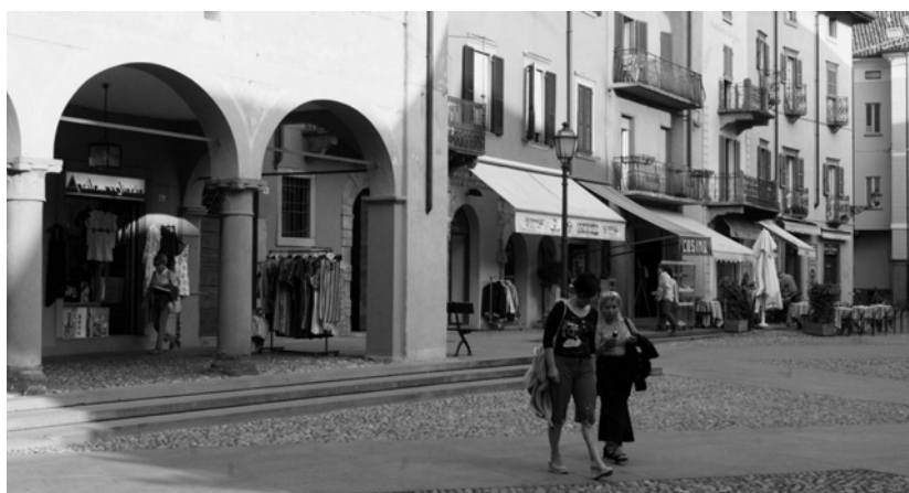
La programmazione comunale punta al completo recupero del centro storico

Fiore all'occhiello sono la nuova sede dell'Ipsia e del liceo scientifico che hanno previsto un impegno di 3 milioni.