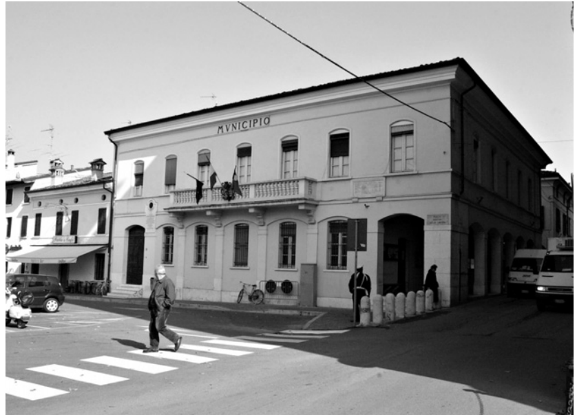
La sede municipale di Castenedolo

Intanto, a Castenedolo continua la stagione delle nuove opere: la pista ciclopedonale fra il Maglio e via Carducci (250 mila euro) collegata anche al recupero delle "strade bianche", il reticolo sulla collina che sarà pronto a primavera (100 mila euro) e costituirà un itinerario completo.